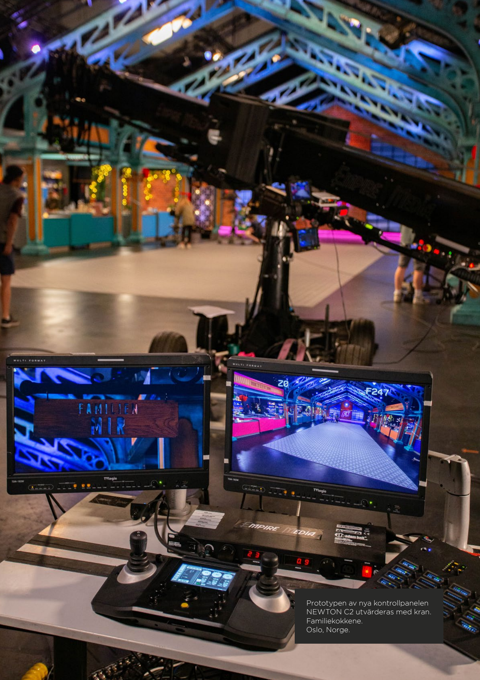
Prototypen av nya kontrollpanelen NEWTON C2 utvärderas med kran. Familiekokkene. Oslo, Norge.