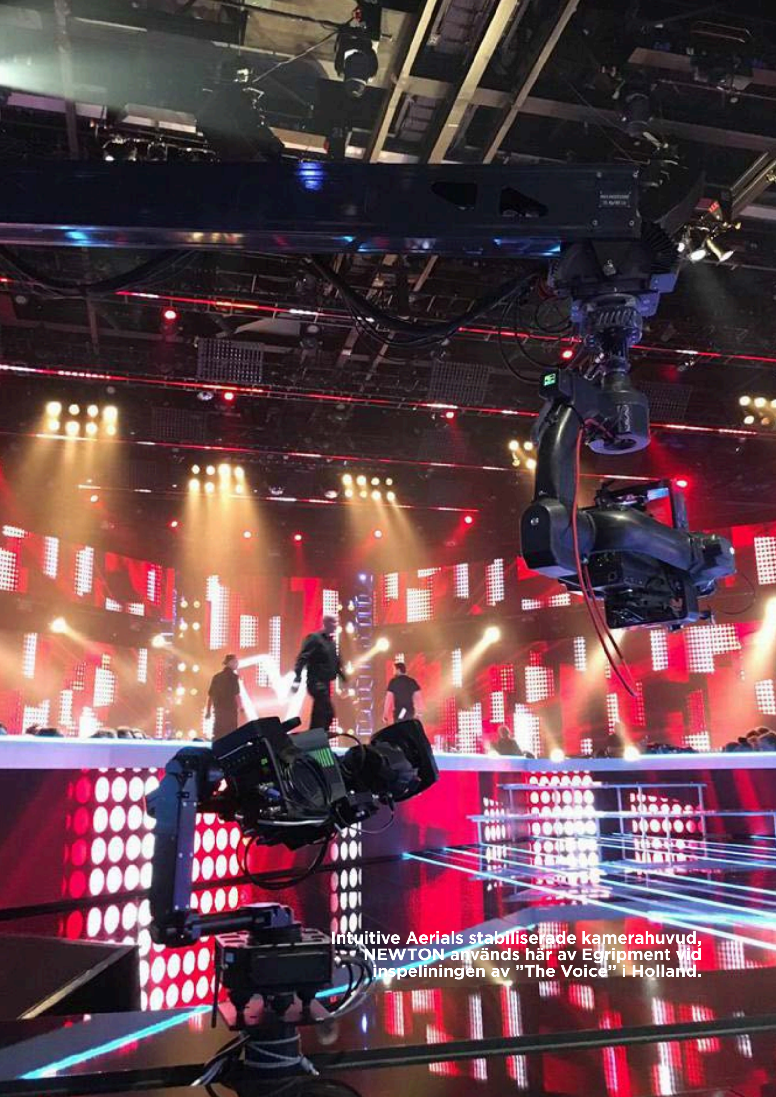
Intuitive Aerials stabiliserade kamerahuvud, NEWTON används här av Egriment Vid inspelningen av "The Voice" i Holland.